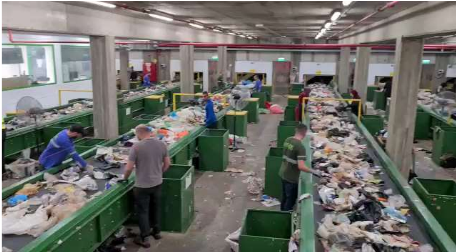
אולם מיון ידני: השלמת תהליך המיון להפרדה אחרונה של מוצרים שונים